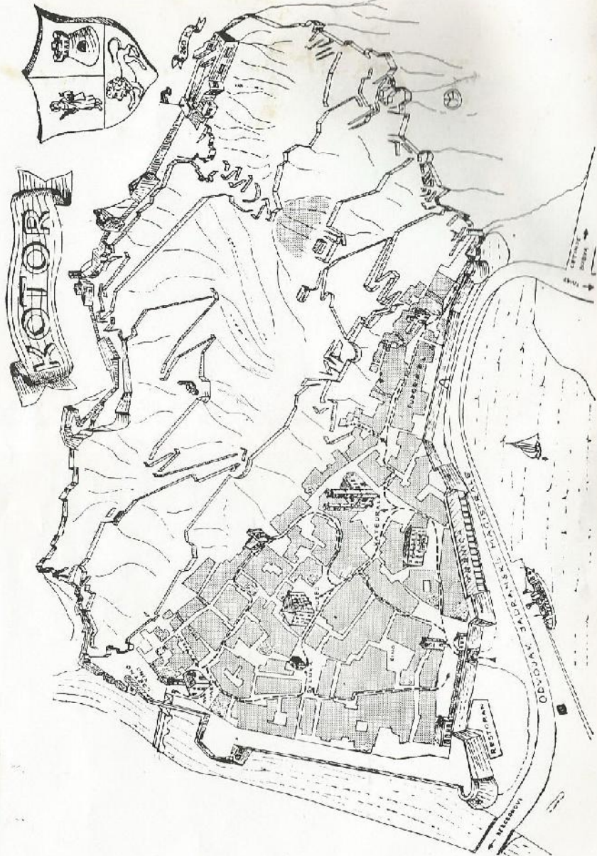
Plan Kotora danas

Izdavač: Boželjska mornarica — Podružnica Split