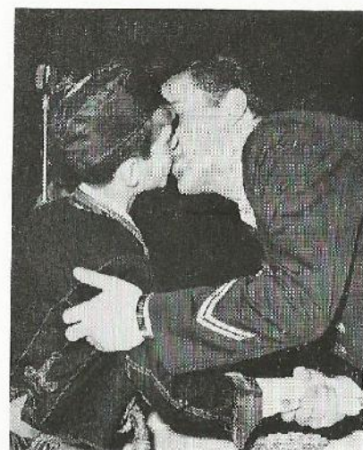
Kontinuitet plemenite tradicije: zagrljaj mladih predstavnika drevne i nove naše mornarice