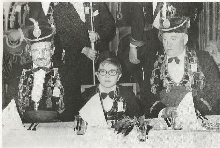
Časnici Bokeljske mornarice iz Kotora, gosti jubilarne 100. godišnjice tradicionalne proslave u gostoljubivom gradu Splitu, 9. II 1973, s malim admiralom

U tome se, pored ostalog, ističe i više nego stoljetna bratska povezanost između gostoljubivog Splita i mile nam Boke.