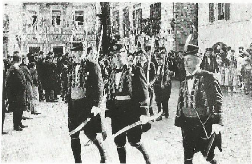
Odred Bokeljske mornarice, u Kotoru 1968. godine, prilikom proslave 50. godišnjice ustanka mornara austrougarskih ratnih brodova u Boki kotorskoj