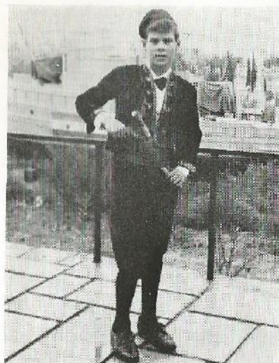
Mali admiral Bokeljske mornarice u Splitu 1971