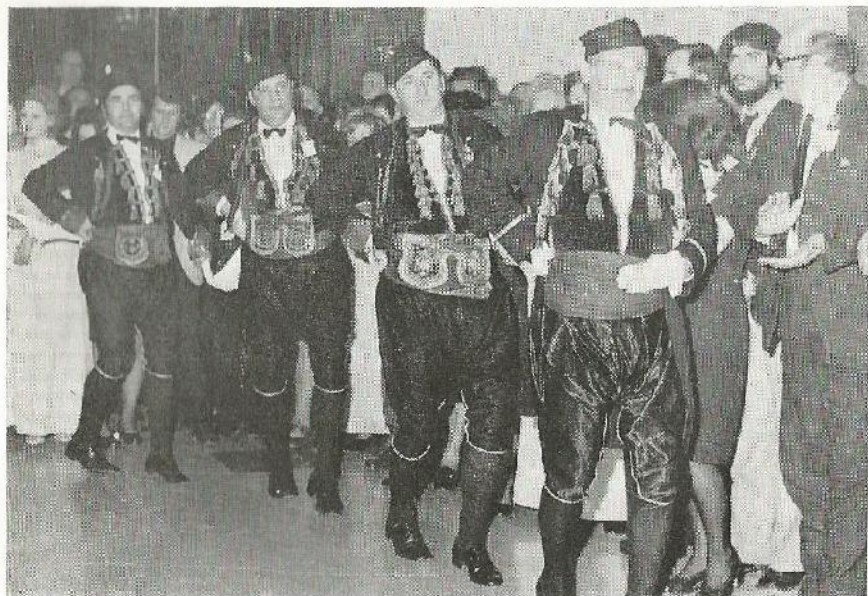
Mornari gosti iz Kotora igraju tradicionalno Kolo Bokeljske mornarice na proslavi jubilarne 100. godišnjice, u Splitu 9. II 1973.