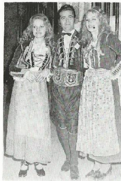
Gosti iz Bčke na jubilarnoj Bokeljskoj večeri 1973. godine — mornar i djevojke iz Lastve u bokeljskoj narodnoj nošnji